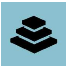
Blok 1: Fundamentals

Deep Change is een veelzijdig en indringend opleidingsprogramma dat is opgebouwd uit drie blokken van ieder twee opleidingsdagen, twee persoonlijke coachingsgesprekken én zeven weken interactieve e-learning, om in je eigen tijd het leren verder door te zetten.