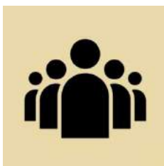
Blok 2: Leadership